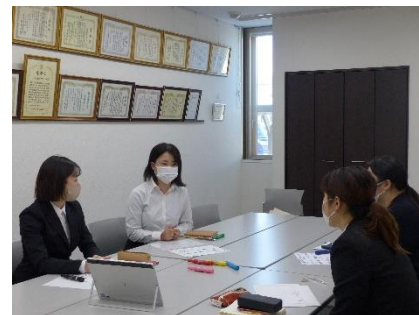
インターンシップ(対面)