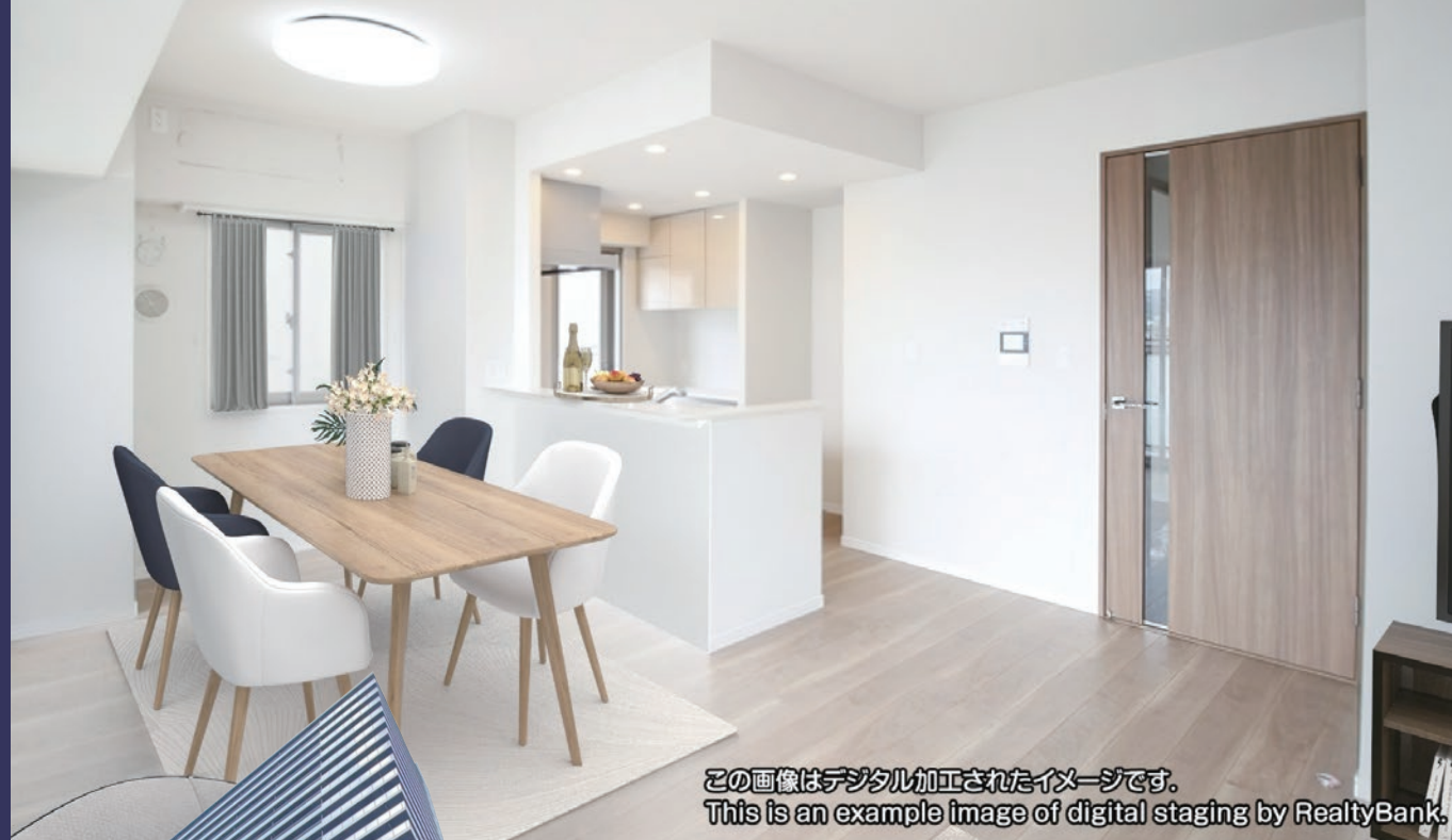
この画像はデジタル加工されたイメージです。 This is an example image of digital staging by RealtyBank.